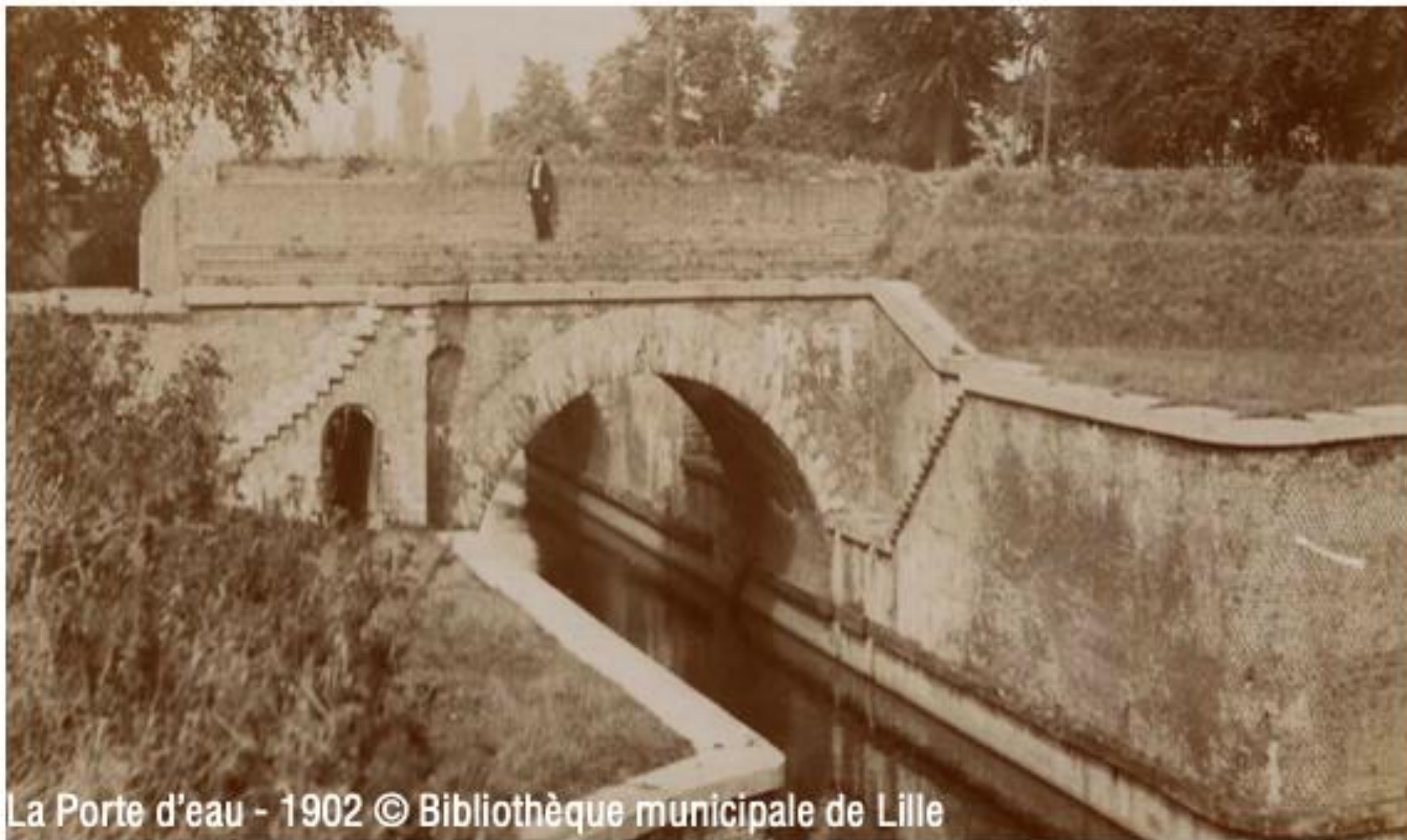
La Porte d'eau - 1902