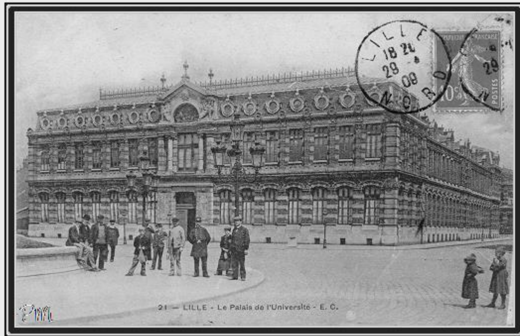
LILLE - Le palais de l'Université