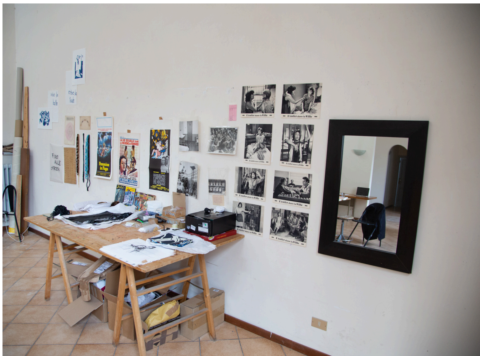
© Christophe Gouazé - Open Studio Lise Lerichomme

Chaque lauréat est en autonomie à Rome et accompagné à distance lors de sa résidence - la Direction des Arts Visuels et de l'Art dans l'Espace Public n'étant pas représentée – mais bénéficie d'un environnement propice à la recherche artistique et à la créativité qui s'appuie sur un réseau de partenaires et de professionnels institutionnels et/ou culturels romains qui sont activés lors de la résidence.