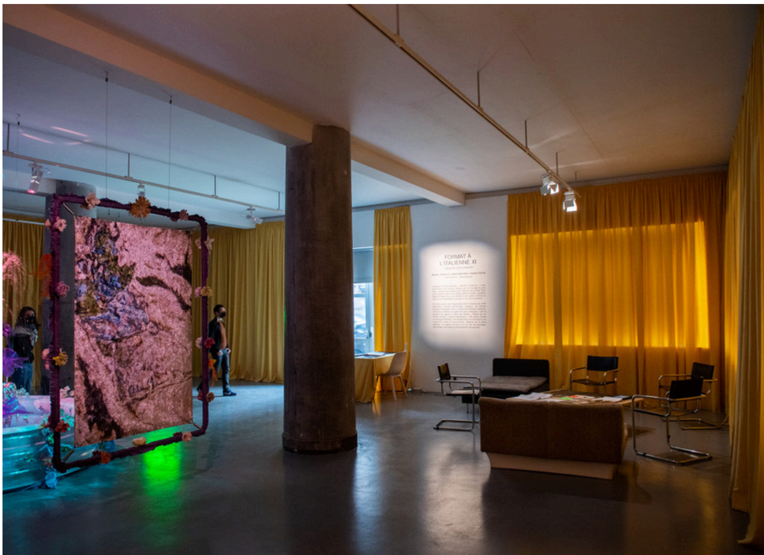
Format à l'italienne XI

Depuis 2023, les lauréats bénéficient de l'accompagnement d'un commissaire invité, lauréat du programme Nouveau Grand Tour. Le programme de résidence Nouveau Grand Tour, porté par l'Institut français et l'Ambassade de France en Italie en partenariat avec la Ville de Lille, a mis en place une résidence de recherche à Rome destinée à un commissaire d'exposition.