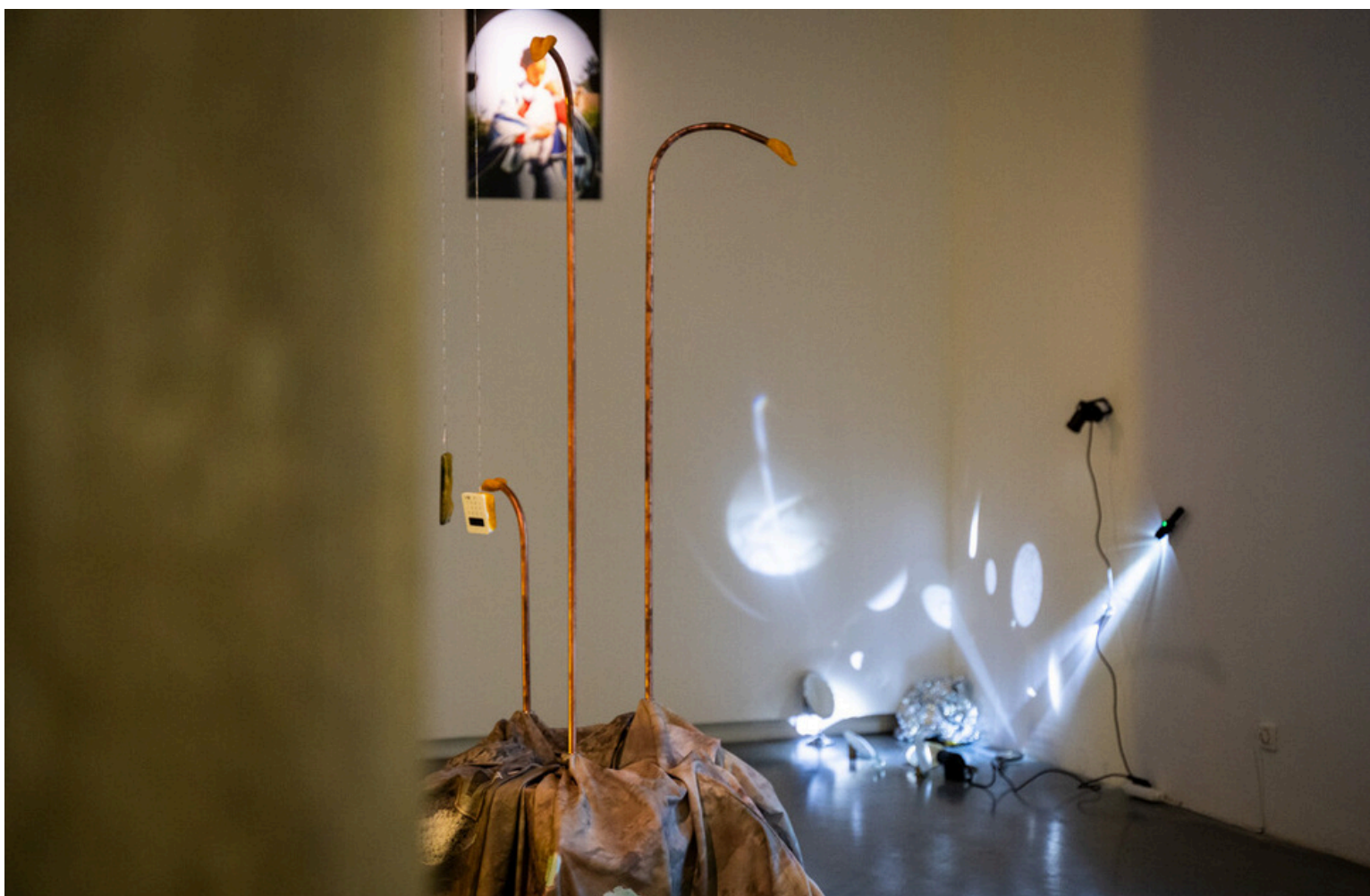
Format à l'italienne XV